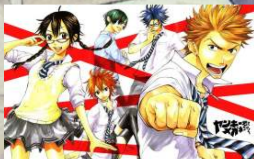
Katekyo Hitman Reborn